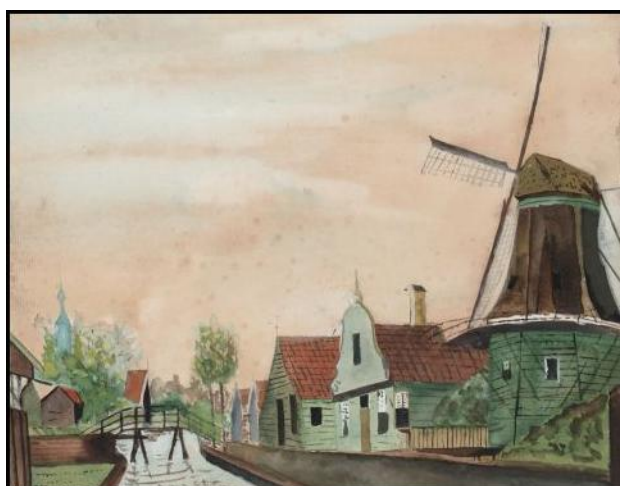
De huidige Westzijde ter hoogte van het voormalige Ruyterveer. Links de wegsloot en enkele houtloodsen, daarboven de torenspits van de Bullekerk. Rechts meelmolen De Ruyter, gebouwd 1639 en gesloopt in 1864.