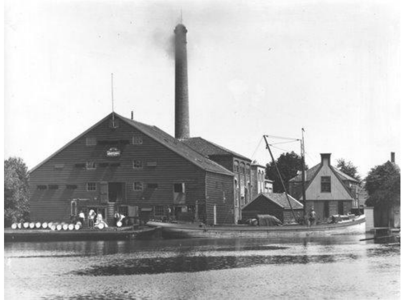
De fabriek de Koningin der Nederlanden. Het houten pakhuis ligt aan de Zaan. Het stenen pand ligt aan een insteekhaven van de Zaan.