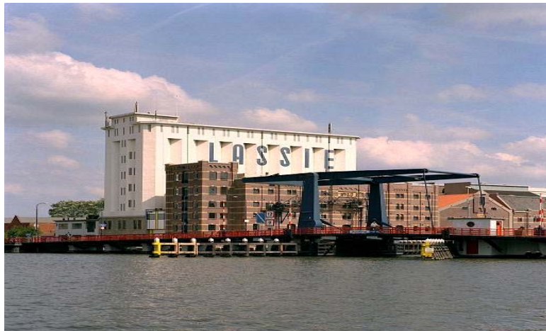
Figuur 12: Deel van de Zaanwand en de Zaanbrug, 2006 (Verhoek)