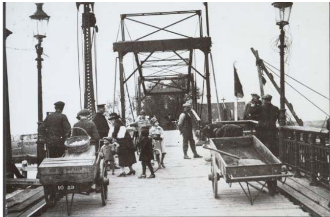
Figuur 6: Bouw van het beweegbare gedeelte van de Zaanbrug: 1926. GAZ

de Wormerveerse gemeenteraad, waar hij ook deel van uitmaakte. Hij stelde daarbij uit eigen middelen een bedrag van fl. 2000,- in het vooruitzicht als beginkapitaal. De gemeenteraad ging akkoord met het plan en een jaar later al, in 1889, kon de Zaanbrug met feestelijk vertoon officieel in gebruik worden genomen. Tegelijk werd aan de Wormer kant, in het verlengde van de brug het Wormer Laantje (later bekend als Nieuweweg) de wegverbinding Zaanbrug – Zandweg, in gebruik genomen, waarvan de aanleg geheel bekostigd was door de gemeente Wormerveer.