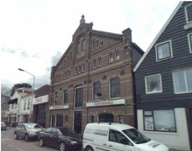
Figuur 9: Houten Zaadpakhuis Amsterdam, rijksmonument

Op de mogelijk nieuwe plek van de brug zijn ook een aantal karakteristieke elementen aanwezig. Hieronder een korte beschrijving en waardestelling.