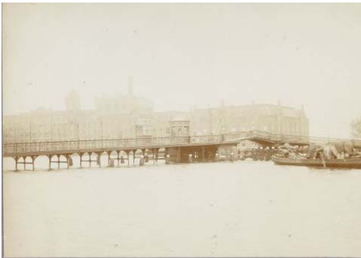
Figuur 1: Eerste aanleg Zaanbrug, omstreek 1900 GAZ