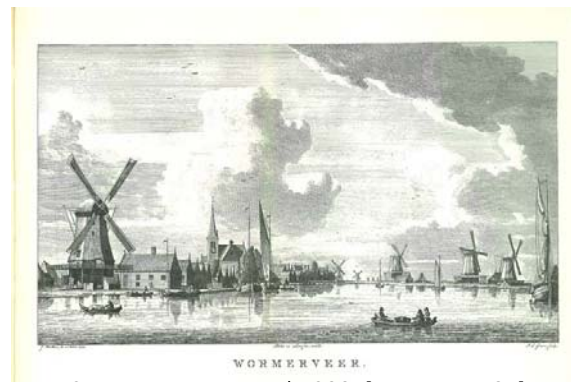
Fig 8: Wormerveer, rond 1800. [Loosjes, 1794]