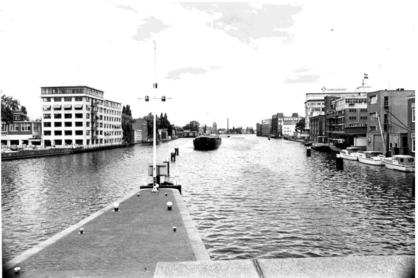
Zaandam – Binnenzaan bij de Wilhelminasluis