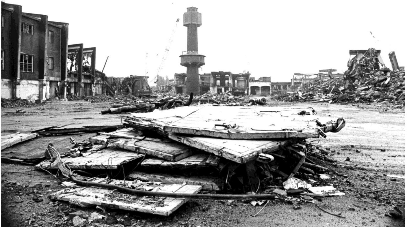
Sloop van Van Gelder Papierfabriek in Wormer