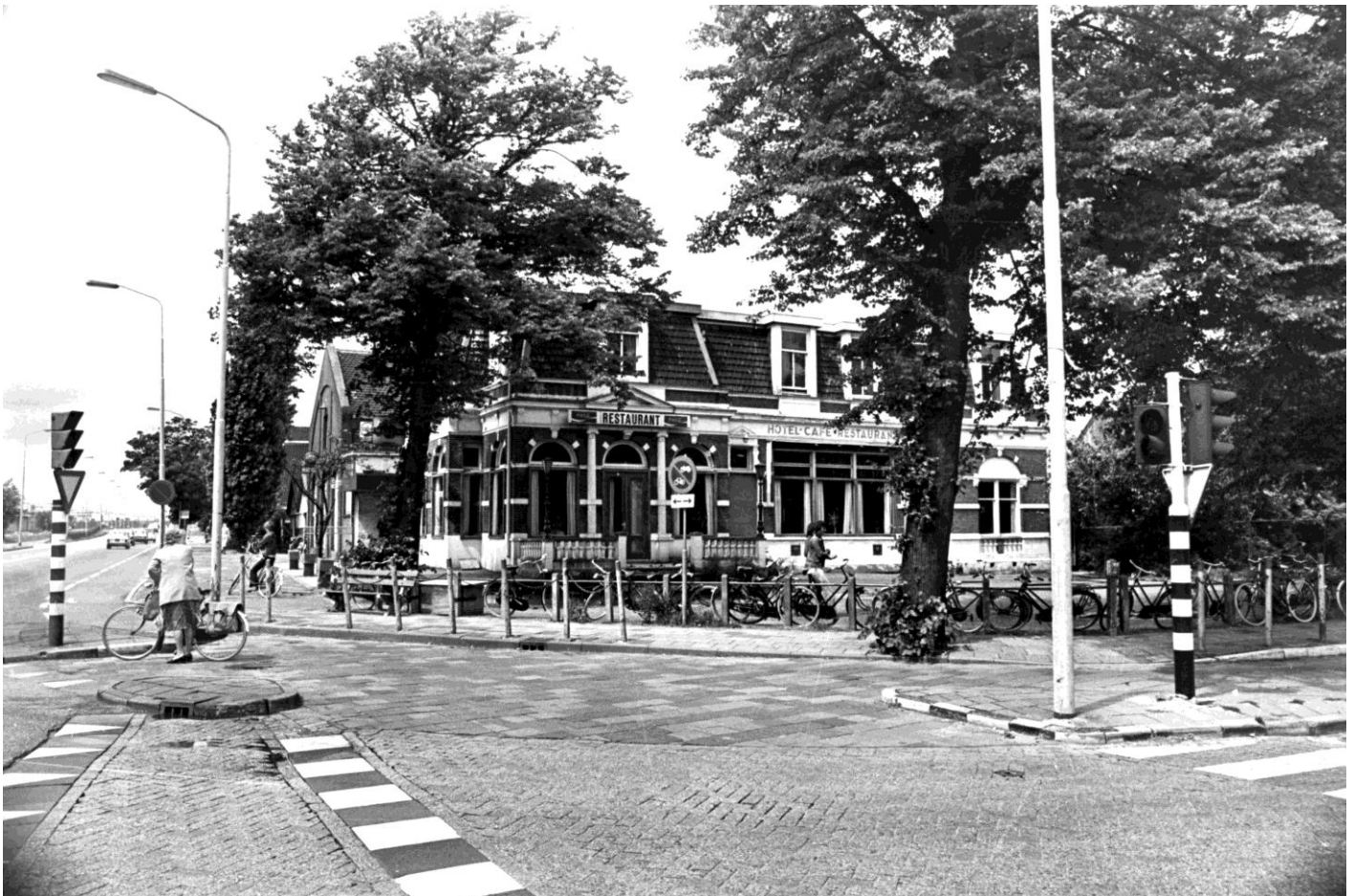
Wormerveer - Café-restaurant en concertzaal de Nieuwe Sociëteit aan de hoek Wandelweg-Stationsstraat.