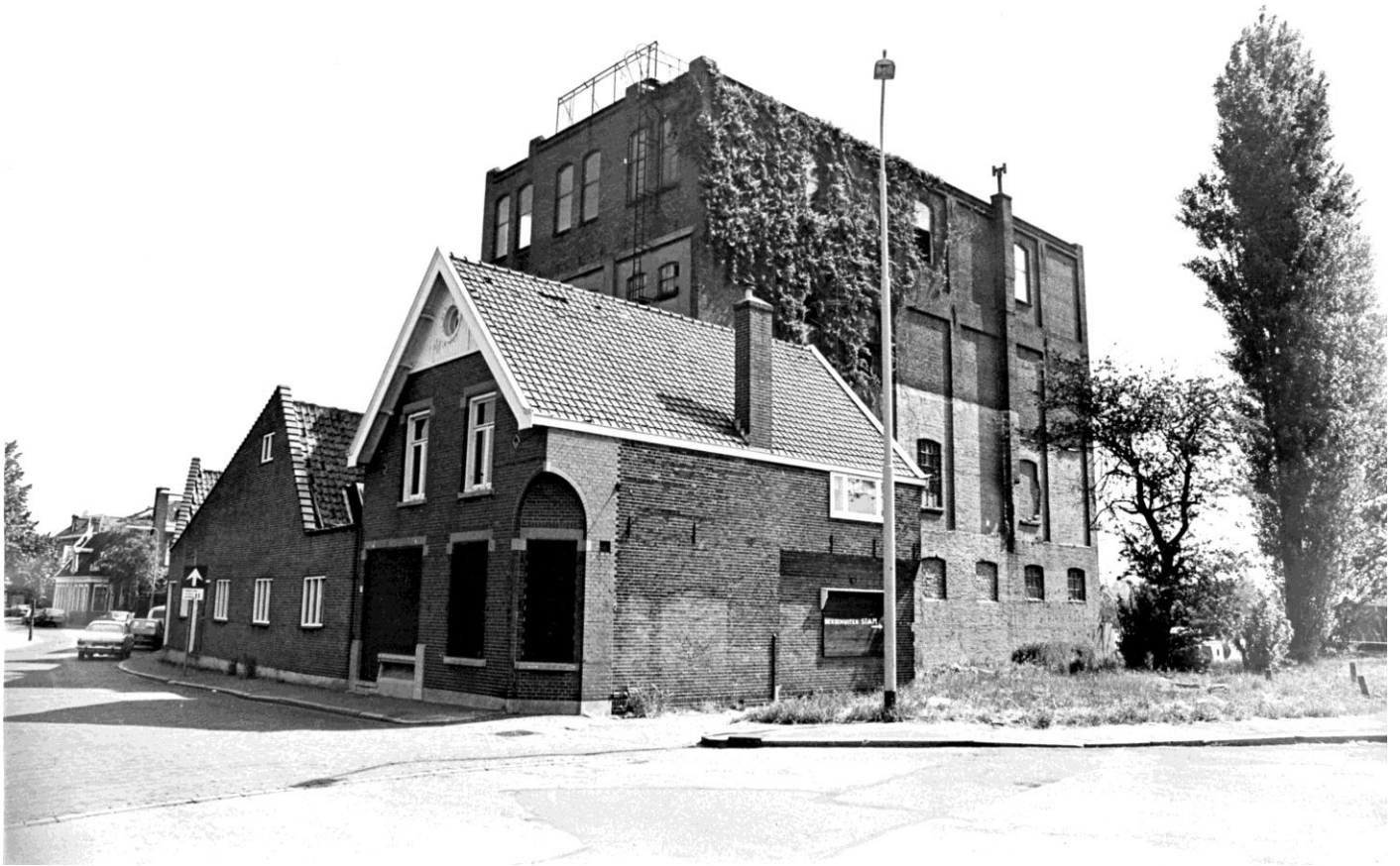
Zaandijk – Lagedijk bij de Guisweg met o.a. de voormalige chocolade en cacaoabriek van Teun Oly & Compagnon.