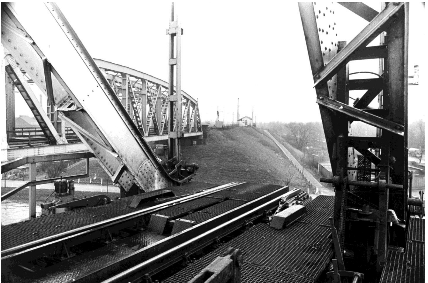
Zaandam – opendraaiende spoorbrug 'De Hembrug'. Op de achtergrond station Hembrug.