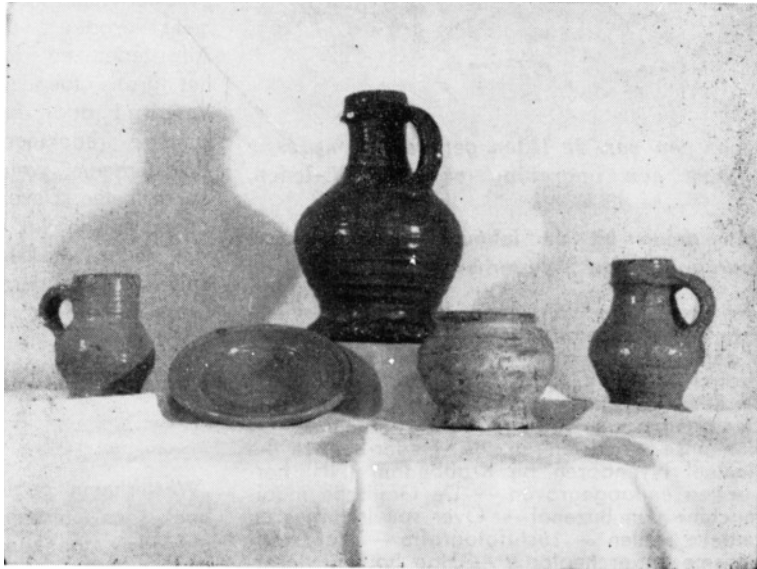
16e eeuwse gebruiks aardewerk, gevonden te Jutphaas

Vorming van nieuwe Werkgroepen worden voorbereid.