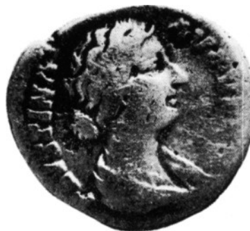
Zilveren Romeinse munt met portret van Keizerin Faustina II en randschrift, gevonden bij Loosduinen. gedateerd op 161—180.

Het hoofdbestuur streeft ernaar om in de toekomst jaarlijks zo'n gelegenheid te scheppen de archeologie in de praktijk te beoefenen.