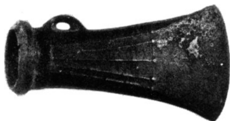
Bronzen bijl, gevonden te Monster. ca. 850—650 v. Chr.