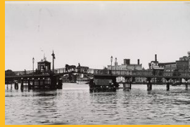
1e Zaanbrug uit 1889 behoorde tot de modernste bruggen van zijn tijd.