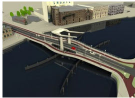
Schetsontwerp Nieuwe Zaanbrug