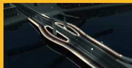
Zaanbrug bij nacht

In 2015 hebben we een gezonde basis gelegd voor het ontwerp. Zo kunnen we vol vertrouwen het nieuwe jaar tegemoet zien. Namens het projectteam Nieuwe Zaanbrug wensen wij u fijne feestdagen en een voorspoedig 2016.