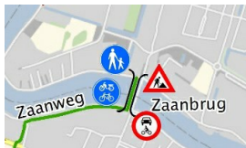
Tijdelijke brugverbinding in de nabijheid van de huidige Zaanbrug