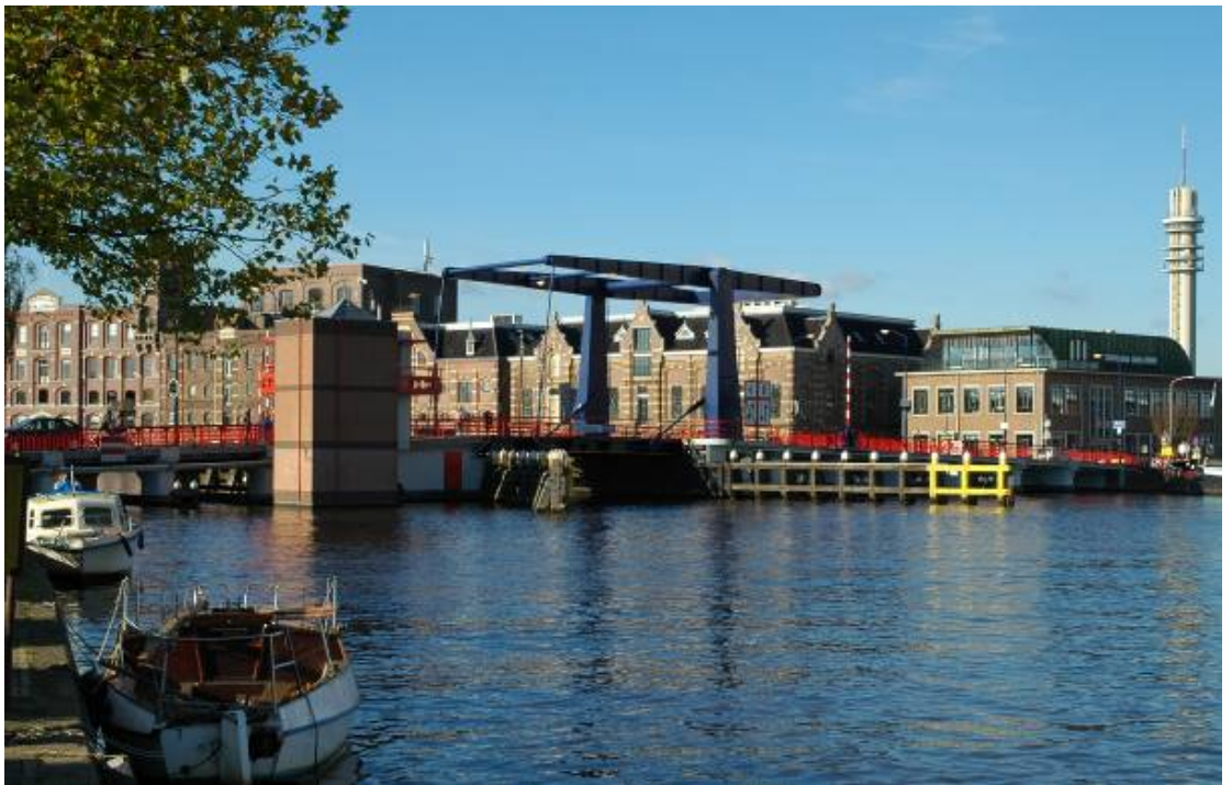
Figuur 4.3 Huidige brug over de Zaan

Komend vanaf Amsterdam maakt de Zaan een flauwe bocht naar rechts (bochtstraal R = 1100\text{ m} ), die op ca 140 m voor de brugdoorvaart overgaat in een bocht naar links met een straal van 375 m. De bochtstraal is bepaald uit de grootste cirkelboog die raakt aan de midden vaarwaterlijn voor en na de bocht en de doorvaartsas van de brug (zie Figuur 4.3). Ca 250 m na de brugdoorvaart ter hoogte van kilometerraai 10,05 gaat de bocht over in een zeer krappe bocht naar rechts met een straal van 125 m (zie Figuur 4.2).