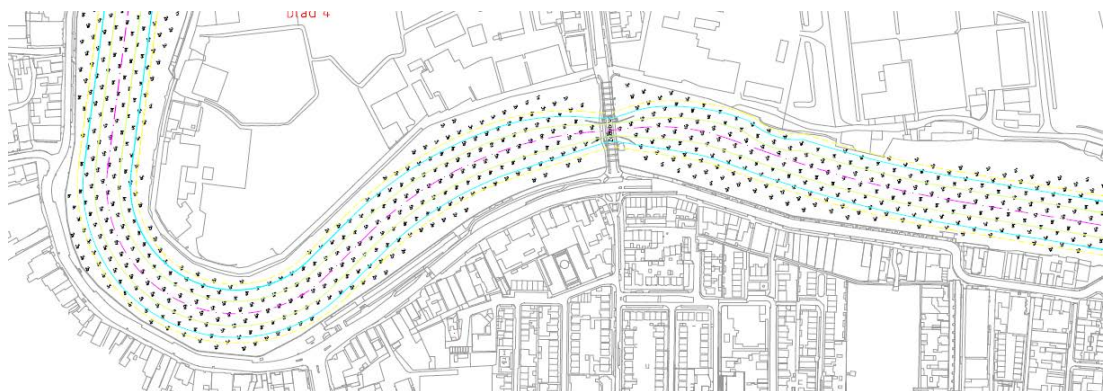
Figuur 4.1 Locatie huidige en nieuwe brug