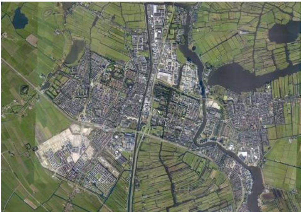
Figure 4-1 Overzicht

De huidige brug is vanaf Amsterdam komend gesitueerd over de Zaan in een bocht naar links ter hoogte van kilometerraai 9,75. De bocht heeft een straal van ca. 375 m. Onderstaande figuren geven een goed beeld van de situering in de vaarweg.