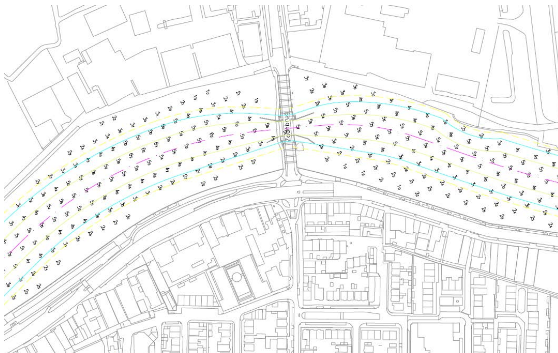
Figuur 4.4 Detailoverzicht bestaande brug

De doorvaarthoogte van de nieuwe brug wordt minimaal gelijk aan de oude brug (ca. 2,30 m). De doorvaarthoogte in geopende stand is onbeperkt tussen de gordingen. Bij de brug zijn in de huidige situatie geen wachtplaatsen.