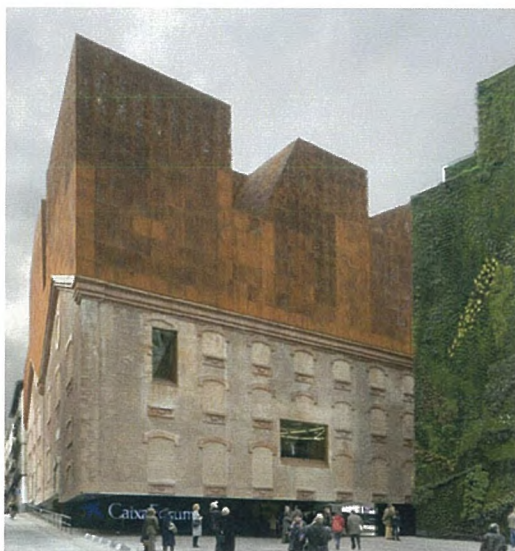
CAIXA Forum Herzog & de Meuron Madrid

Verder zijn er ook een aantal eerdere adviezen afgegeven die mede de richting hebben bepaald van het ontwerp om te komen tot een overtuigende referentie. Dit zijn kort samengevat: