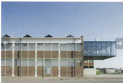
MTV gebouw NDSM Amsterdam

Voordat we begonnen aan het ontwerp is er door de gemeente een aantal voorbeelden voor beeldkwaliteit aangeleverd die de ontwerper als inspiratiedocument kon gebruiken om de overtuigende referentie in het ontwerp aan te brengen. (Beeldkwaliteit en voorbeelden voor de Bruynzeelhallen en IKEA d.d. 6 december 2012) Hieronder een aantal afbeeldingen uit dit document om de richting aan te geven vanuit de gemeente hoe en waar de overtuigende referentie gezocht kon worden.